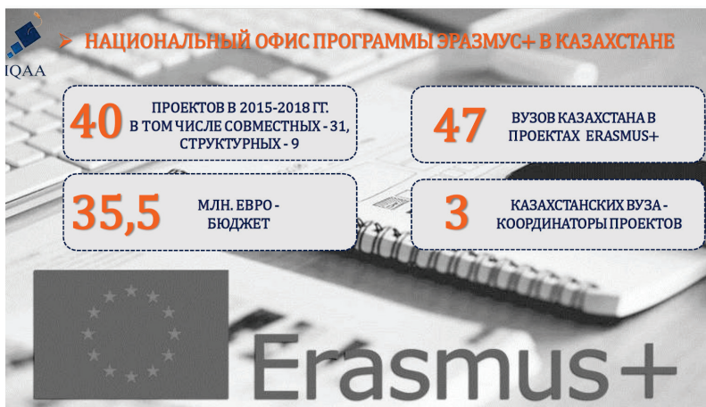
Диаграмма 4. Национальный офис программы Erasmus+ в Казахстане