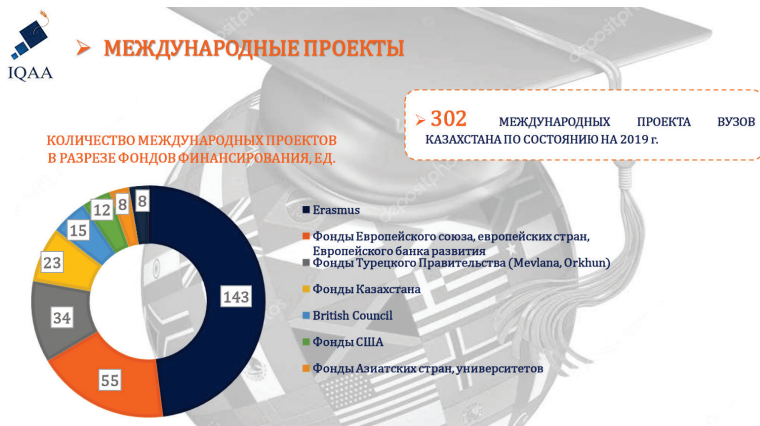
Диаграмма 3. Международные проекты